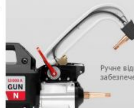
Ручне відкриття рукоятки для забезпечення відстані 200 мм