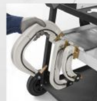
Інтегрована підтримка рук