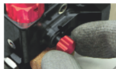
Регулювання швидкості встановлення заклепок

Швидкість штока та силу заклепки можна регулювати вручну відповідно до типу матеріалу, що з'єднується, щоб запобігти будь-якій деформації листів.