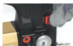
Регульований тиск від 0 до 8 бар