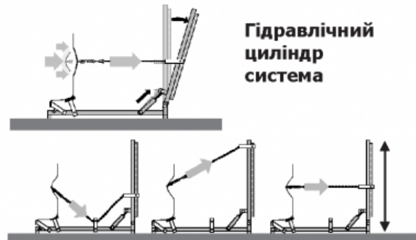
Гідравлічний циліндр система