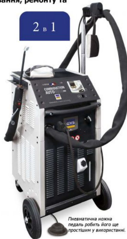
Пневматична ножна педаль робить його ще простішим у використанні.