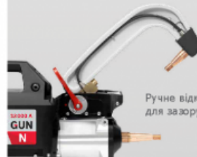
Ручне відкривання кронштейна для зазору 200 мм