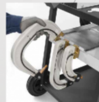
Вбудована опора для рук