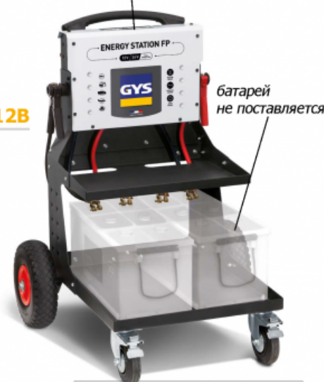
батарей не поставляется