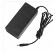
Зарядний блок 230В + зарядний кабель