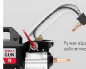
Ручне відкриття рукоятки для забезпечення відстані 200 мм