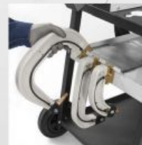
Інтегрована підтримка рук